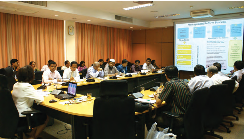
คณะข้าราชการจากส่วนราชการต่าง ๆ ของประเทศบังกลาเทศศึกษาดูงานและรับฟังการบรรยายในหัวข้อ "Public Sector Development Initiatives: Thailand Experience" ณ ห้องประชุมฝ่ายบริหาร ชั้น 5 สำนักงาน ก.พ.ร. เมื่อวันที่ 25 กรกฎาคม 2554