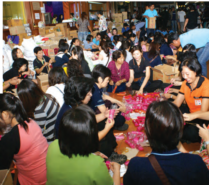
บุคลากรสำนักงาน ก.พ.ร. นำเงินไปบริจาคและร่วมกันบรรจุสิ่งของใส่ถุงยังชีพสำหรับนำไปบริจาคแก่ผู้ประสบอุทกภัย ณ ศูนย์ปฏิบัติการช่วยเหลือผู้ประสบอุทกภัย (ศปภ.) ณ ท่าอากาศยานดอนเมือง เมื่อวันที่ 13 และ 19 ตุลาคม 2554