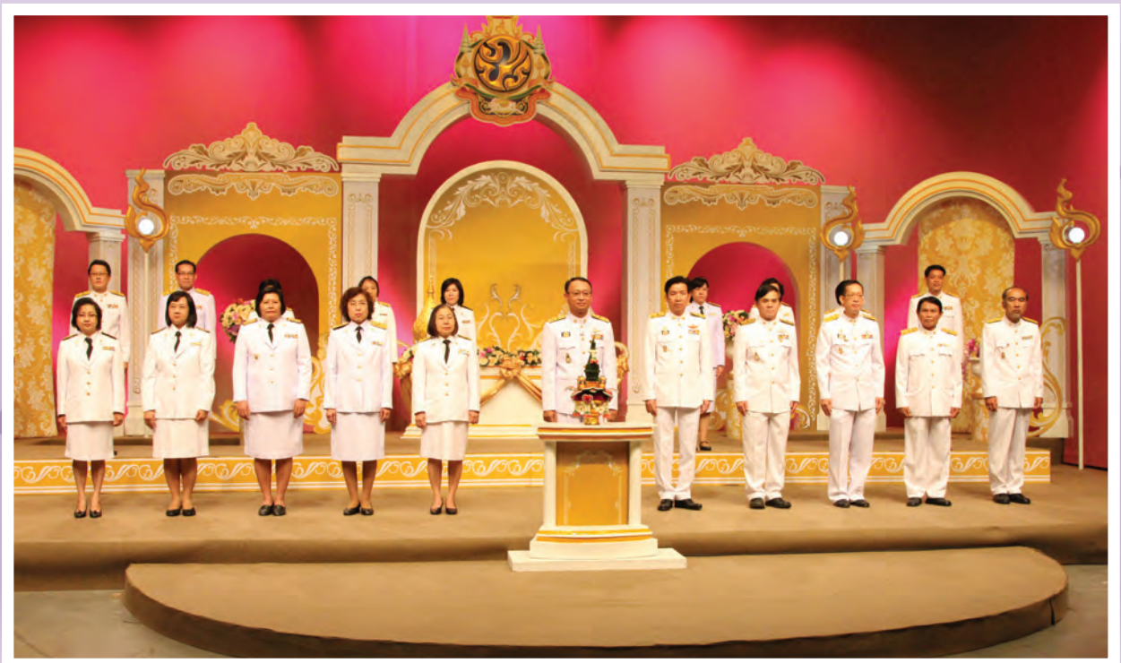
ผู้บริหารและข้าราชการสำนักงาน ก.พ.ร. บันทึกเทปโทรทัศน์กล่าวอาเศียรวาทถวายพระพรชัยมงคล เนื่องในโอกาสวันเฉลิมพระชนมพรรษาของพระบาทสมเด็จพระเจ้าอยู่หัว ณ สถานีวิทยุโทรทัศน์แห่งประเทศไทย