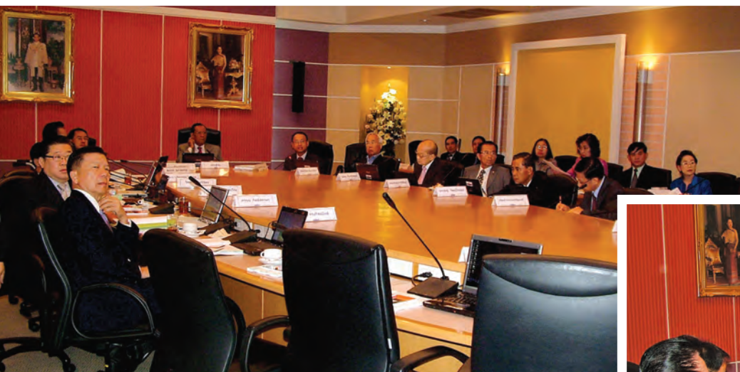
การประชุม ก.พ.ร. ณ ห้องประชุม ก.พ.ร. ชั้น 5 สำนักงาน ก.พ.ร.