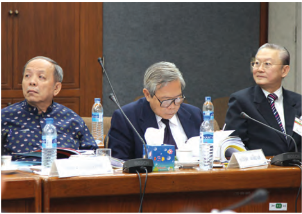
การประชุมคณะกรรมการตรวจสอบและประเมินผล ภาคราชการ (ค.ต.ป.) ครั้งที่ 1 / 2554 ณ ห้องประชุม 215 - 216 อาคารรัฐสภา 2 เมื่อวันที่ 28 เมษายน 2554