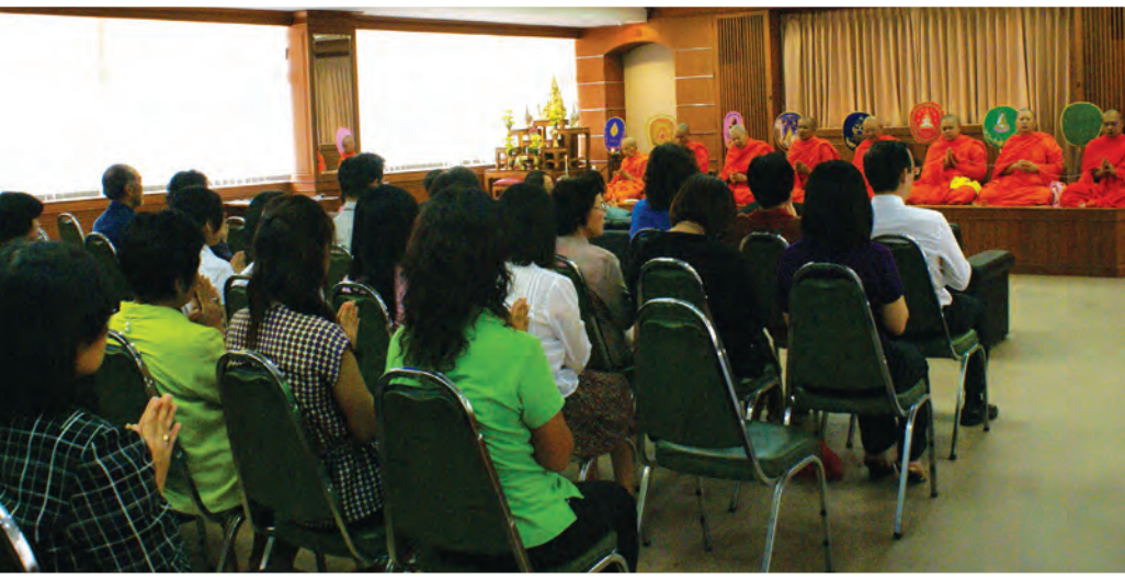
กิจกรรมเนื่องในวันคล้ายวันสถาปนาสำนักงาน ก.พ.ร. ครบรอบปีที่ 9 และกิจกรรมบำเพ็ญสาธารณประโยชน์ ณ วัดเบญจมบพิตร เมื่อวันที่ 15 กันยายน 2554