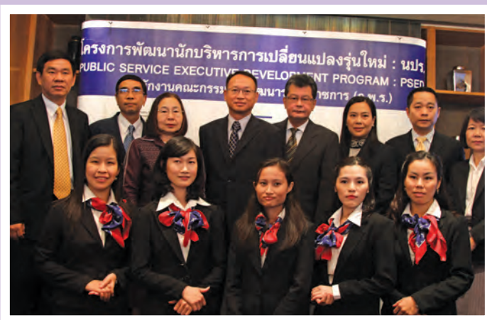
งานแถลงข่าวเปิดตัวโครงการพัฒนานักบริหาร การเปลี่ยนแปลงรุ่นใหม่ รุ่นที่ 5 ณ โรงแรมเรเนซองส์ เมื่อวันที่ 5 มกราคม 2554