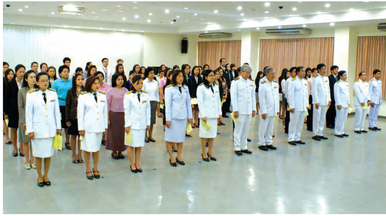
พิธีถวายสัตย์ปฏิญาณเพื่อเป็นข้าราชการที่ดีและพลังของแผ่นดิน ณ ห้องประชุม 501 - 502 ชั้น 5 สำนักงาน ก.พ.ร.