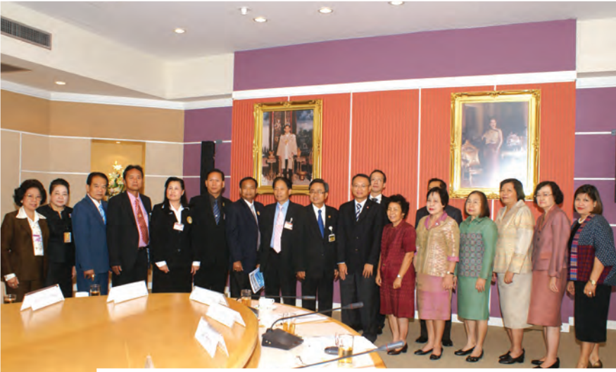
คณะกรรมการศึกษาตรวจสอบเรื่องการทุจริต และเสริมสร้างธรรมาภิบาล และคณะอนุกรรมการเสริมสร้างธรรมาภิบาลในการจัดการศึกษา วุฒิสภา ศึกษาดูงานและแลกเปลี่ยนความคิดเห็นกับผู้บริหารสำนักงาน ก.พ.ร. ในเรื่องของการเสริมสร้างธรรมาภิบาล ณ ห้องประชุม ก.พ.ร. ชั้น 5 สำนักงาน ก.พ.ร. เมื่อวันที่ 7 กันยายน 2554