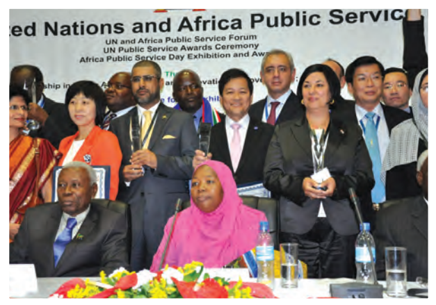
พิธีมอบรางวัล United Nations Public Service Awards 2011 เมื่อวันที่ 23 มิถุนายน 2554 โดย สำนักงานสรรพากรภาค 7 กรมสรรพากร ได้รับรางวัลชนะเลิศ (1st Place Winner) สาขาการเสริมสร้างการบริหารจัดการองค์ความรู้ภาครัฐ และกรมชลประทาน ได้รับรางวัลรองชนะเลิศ (2nd Place Winner) สาขาการเสริมสร้างการมีส่วนร่วมในกระบวนการตัดสินใจโดยการใช้เทคโนโลยีใหม่