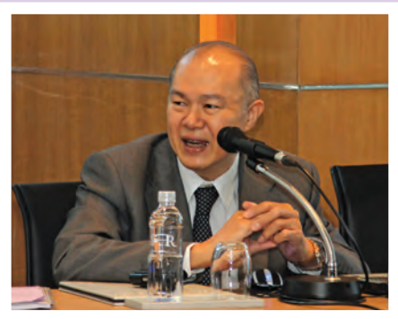
การสัมมนาผู้บริหารภาคเอกชนผู้เป็นครูผู้ฝึกสอน (Mentor) โครงการพัฒนานักบริหารการเปลี่ยนแปลง รุ่นใหม่ รุ่นที่ 4 ณ โรงแรมเรนเนซวงส์ ราชประสงค์ เมื่อวันที่ 24 มีนาคม 2554