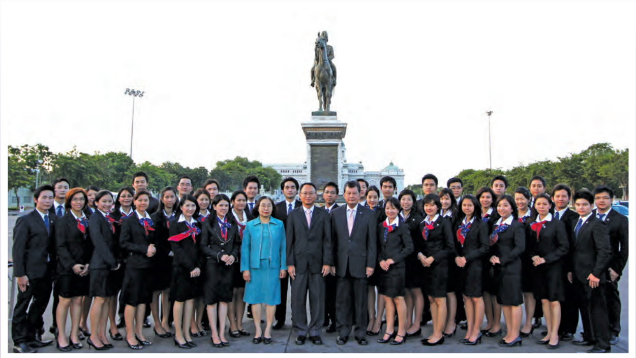
นักบริหารการเปลี่ยนแปลงรุ่นใหม่ รุ่นที่ 5 ร่วมพิธีสักการะองค์สมเด็จพระปิยมหาราช ณ ลานพระบรมรูปทรงม้า เมื่อวันที่ 14 มิถุนายน 2554