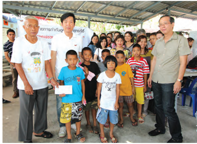
กิจกรรมบำเพ็ญสาธารณประโยชน์และพัฒนา ความเป็นอยู่ที่ต.ขอมสัวคม / ชุมชนภายใต้ “โครงการชวนกันทำดี...เพื่อสัวคม” ณ ชุมชนห้วยรถจักร ตึกแดง 3 บางซื่อ เมื่อวันที่ 9 กรกฎาคม 2554