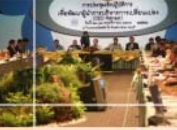
การประชุมเชิงปฏิบัติการเพื่อ การพัฒนาผู้นำการบริหาร การเปลี่ยนแปลง (CEO Retreat) ณ โรงแรมรอยัลคลิฟปีช รีสอร์ท พัทยา จ.ชลบุรี วันที่ 22 – 26 พฤศจิกายน 2547

การบรรยายพิเศษเพือการเรียนรู้การเปลี่ยนแปลงของโลกสู่ การปฏิบัติราชการของไทยจากนักวิขาการระดับโลกให้แก่ผู้บริหาร ระดับ สูงของส่วนราชการ และผู้ว่าราชการจังหวัด ณ ศูนย์การประชุม สหประชาชาติ วันที่ 21 ธันวาคม 2547