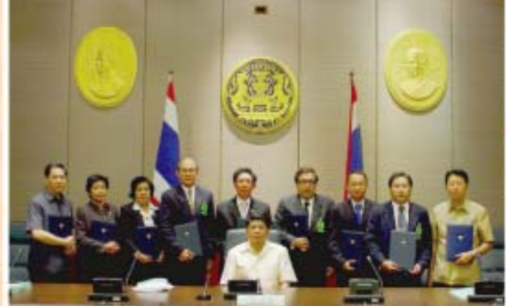
การพิจารณากลันกรองแผนยุทธศาสตร์และการลงนาม คำรับรองการปฏิบัติราชการประจำบึงบประมาณ พ.ศ. 2548 ของส่วน ราชการสังกัดสำนักนายกรัฐมนตรี หน่วยงานไม่สังกัดสำนัก นายกรัฐมนตรี กระทรวง หรือทบวง และกลุ่มจังหวัด /จังหวัด วันที่ 27 ธันวาคม 2547 – 5 มกราคม 2548