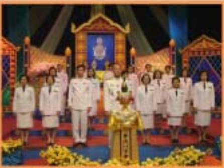
ผู้บริหารและข่าราชการสำนักงาน 1.พ.ร. ร่วมบันทึกเทปโทรทัศน์กล่าว ลาเพียรวาทกวายพระพรชัยมงคล เนื่องในวโรกาสวันเฉลิมพระขนม พรรษาของพระบาทสมเด็จพระเจ้าอยู่หัว น. สถาบีวิทยุโทรทัศน์แห่งประเทศโทย ปอง 11 กรมประชาสัมพันธ์ วันที่ 19 พฤศจิกายน 2547

ส้มมนาทิศทางการดำเนินงานของ สำนักงาน ก.พ.ร. ในปังบุประมาณ พ.ศ. 2548 ณ โรงแรม Adriatic Palace พัทยา จ.ชลบุรี วันที่ 12 – 14 มีนาคม 2547