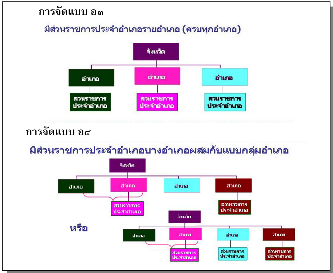
ภาพที่ ๗ แสดงรูปแบบการจัดส่วนราชการบริหารส่วนภูมิภาคระดับอำเภอ แบบ ๐๓ และ ๐๔