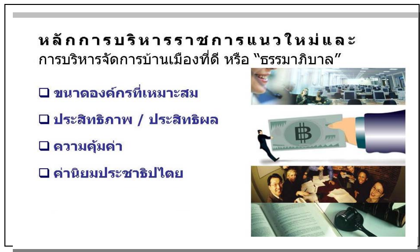
ภาพที่ ๓ แสดงหลักการบริหารราชการแนวใหม่และการบริหารกิจการบ้านเมืองที่ดี

๑.๒ หลักความสัมพันธ์ในเชิงกฎหมายปกครองระหว่างราชการบริหารส่วนกลางกับราชการบริหารส่วนภูมิภาค ซึ่งถือว่าราชการบริหารส่วนภูมิภาคมีฐานะเป็นผู้แทนของรัฐบาลในการบริหารราชการในระดับพื้นที่ และเป็นผู้แทนของกระทรวง ทบวง กรมในการปฏิบัติราชการตามอำนาจและหน้าที่ของกระทรวง ทบวง กรมให้เหมาะสมกับท้องที่และประชาชนภายในเขตจังหวัด และการกำกับดูแลและการบังคับใช้กฎหมายเพื่อประโยชน์ของสังคม รวมตลอดถึงการมีความสัมพันธ์ตามกฎหมายกับองค์กรปกครองส่วนท้องถิ่นและประชาชนในจังหวัดนั้น ในฐานะที่เป็นองค์กรเชื่อมโยงของราชการบริหารส่วนกลางกับองค์กรปกครองส่วนท้องถิ่นและประชาชน