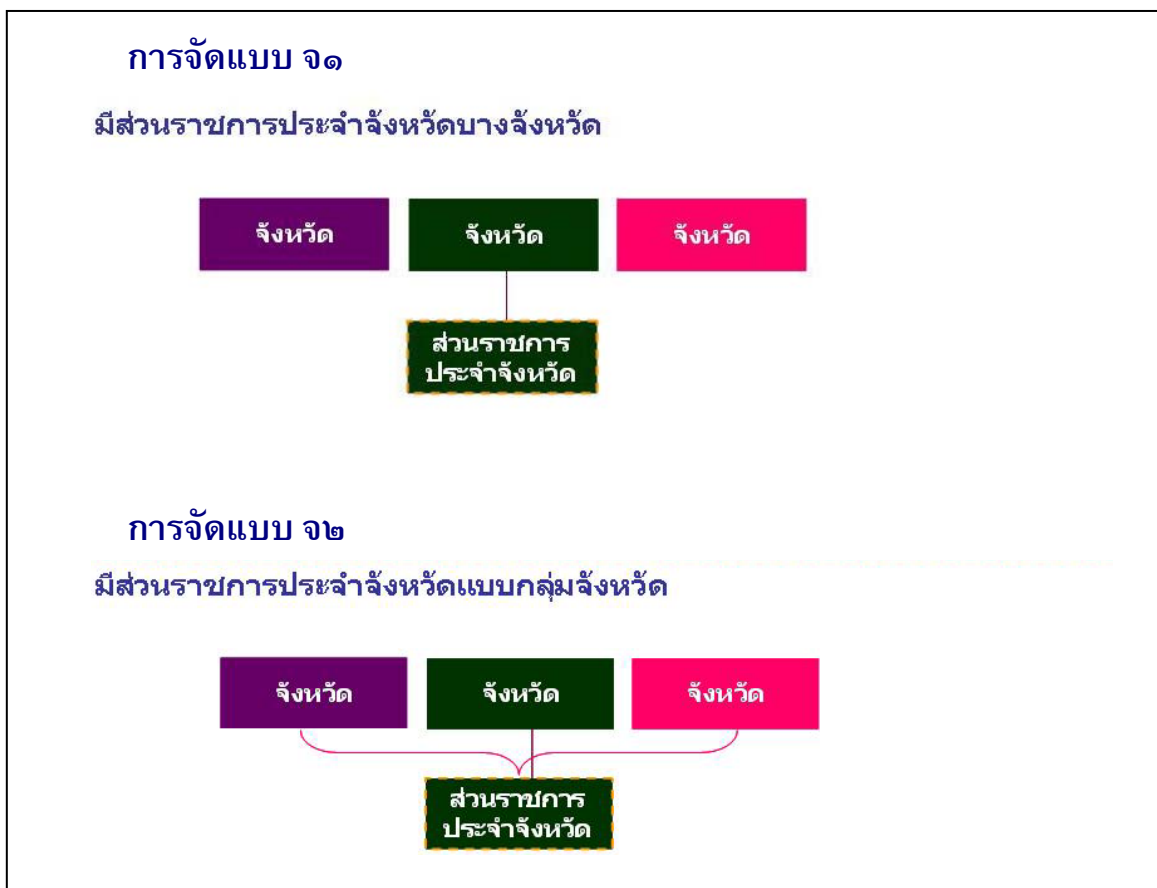
ภาพที่ ๔ แสดงรูปแบบการจัดส่วนราชการบริหารส่วนภูมิภาคระดับจังหวัด

(๑.๔) การจัดแบบ จ๔ “มีส่วนราชการประจำจังหวัดบางจังหวัดผสมกับแบบกลุ่มจังหวัด” เป็นรูปแบบผสมคือ การมีส่วนราชการประจำจังหวัดที่รับผิดชอบเฉพาะจังหวัดที่ส่วนราชการนั้นตั้งอยู่ และกรณีที่ไม่นอกจากรับผิดชอบในพื้นที่จังหวัดที่ตั้งแล้วต้องรับผิดชอบในพื้นที่ของจังหวัดใกล้เคียงในรูปของกลุ่มจังหวัด โดยการจัดลักษณะนี้นั้นอาจครอบคลุมทั้ง ๗๕ จังหวัด หรือไม่ก็ได้