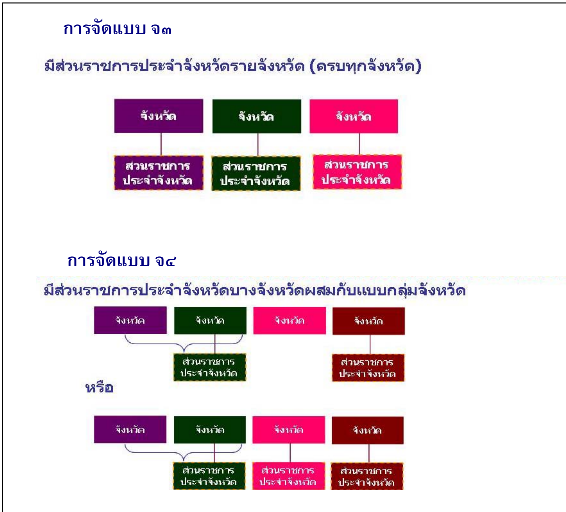
ภาพที่ ๕ แสดงรูปแบบการจัดส่วนราชการบริหารส่วนภูมิภาคระดับจังหวัด แบบ จ๓ และ จ๔