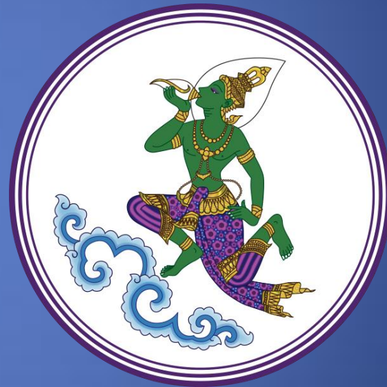
กรมประชาสัมพันธ์ สำนักนายกรัฐมนตรี