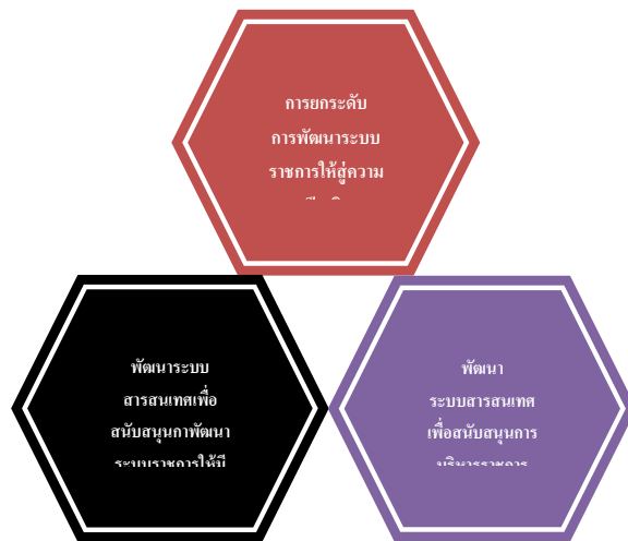
ภาพที่ ๑ ยุทธศาสตร์การพัฒนาระบบเทคโนโลยีสารสนเทศของสำนักงาน ก.พ.ร.

และแนวโน้มในอนาคต โดยยึดหลักและให้ความสำคัญกับทุกประเด็น ดังกล่าวเพื่อนำมาใช้ในการสรุปประเด็นยุทธศาสตร์การพัฒนาระบบเทคโนโลยีสารสนเทศ ในแผนพัฒนาระบบ