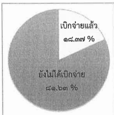
แผนภูมิที่ ๓ : แสดงการเบิกจ่าย งบประมาณของกลุ่มจังหวัด

◆ มีงบประมาณที่ยังไม่ได้เบิกจ่าย จำนวน ๑๑,๕๒๒,๙๙๒,๕๖๔ บาท (หนึ่งหมื่นหนึ่งพันห้าร้อยยี่สิบล้านเก้าแสนเก้าหมื่นสองพันห้าร้อยหกสิบบ สี่บาทถ้วน) คิดเป็น ร้อยละ ๖๖.๗๓