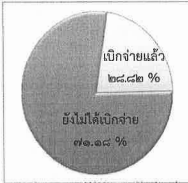
แผนภูมิที่ ๑ : แสดงการเบิกจ่าย งบประมาณทั้งหมด

พระราชบัญญัติงบประมาณรายจ่ายประจำปีงบประมาณ พ.ศ. ๒๕๕๙ บังคับใช้ ณ วันที่ ๑ ตุลาคม ๒๕๕๘ ได้จัดสรรงบประมาณตามแผนปฏิบัติการ ประจำปีของจังหวัด และกลุ่มจังหวัด ซึ่งเป็นไปตามกรอบแผนพัฒนา จังหวัด และกลุ่มจังหวัด ดังนี้ได้รับจัดสรรงบประมาณทั้งหมด จำนวน ๒๔,๖๒๙,๙๕๔,๒๐๐ บาท (สองหมื่นสี่พันหกร้อยยี่สิบเก้าล้านเก้าแสนห้าหมื่น สี่พันสองร้อยบาทถ้วน) ณ วันที่ ๓๐ เมษายน ๒๕๕๙