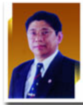
รองนายกรัฐมนตรี (นายวิษณุ เครืองาม) ประธาน ก.พ.ร.