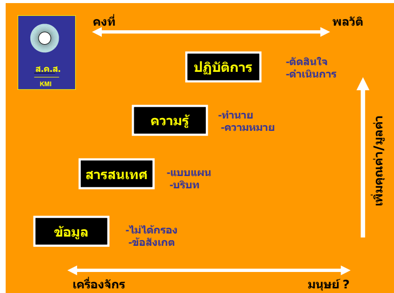
แผนภาพที่ 2

ในการจัดการสมัยใหม่ โดยเฉพาะอย่างยิ่งในยุคแห่งสังคมที่ใช้ความรู้เป็นฐาน (Knowledge-based society) มองความรู้ว่าเป็นทุนปัญญา หรือทุนความรู้สำหรับใช้สร้างคุณค่าและมูลค่า (value) การจัดการความรู้เป็นกระบวนการใช้ทุนปัญญา นำไปสร้างคุณค่าและมูลค่า ซึ่งอาจเป็นมูลค่าทางธุรกิจหรือคุณค่าทางสังคมก็ได้